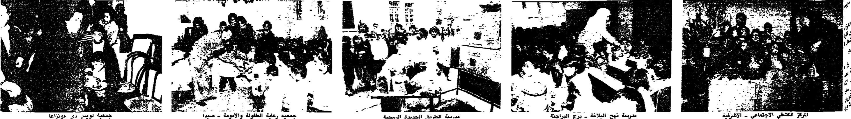
جمعية لويس دي غوزاغا